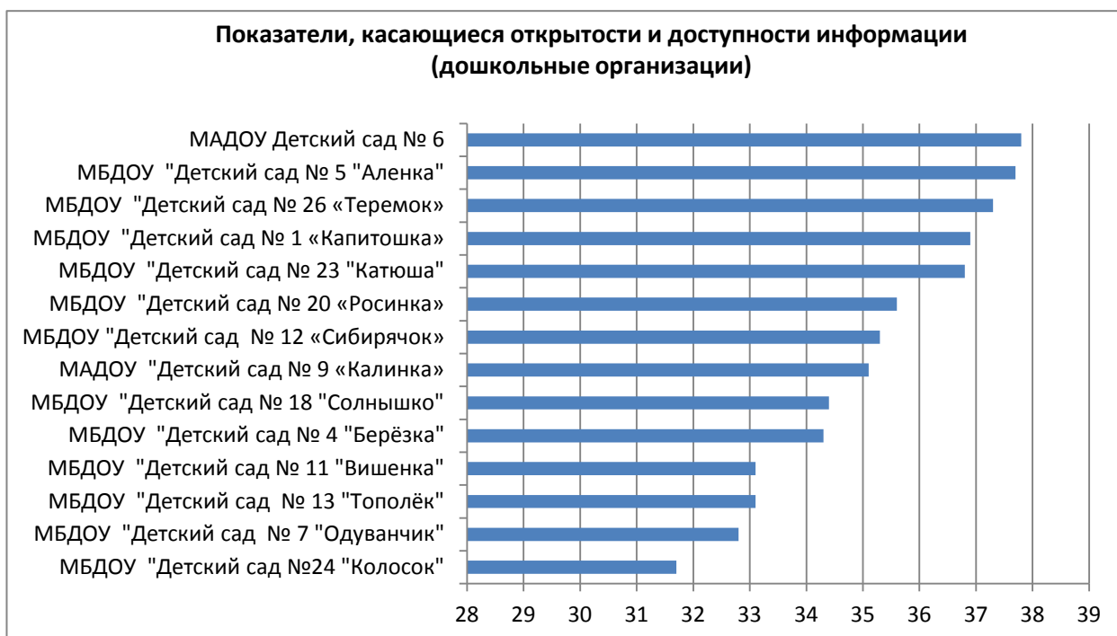
Диаграмма № 1

Наименьшее количество баллов по информационной открытости среди учреждений дошкольного образования набрали МБДОУ «Детский сад №24 «Колосок», МБДОУ «Детский сад № 7 «Одуванчик», МБДОУ «Детский сад № 11 «Вишенка», МБДОУ «Детский сад № 13 «Тополёк» (диаграмма 1). Респонденты отмечают недостаточные 1 возможности для взаимодействия с образовательной организацией в МБДОУ «Детский сад № 13 «Тополёк», МБДОУ «Детский сад № 11 «Вишенка», МБДОУ «Детский сад №24 «Колосок».