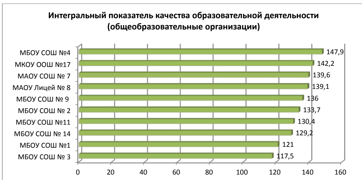
Диаграмма № 10

Таким образом, среди дошкольных образовательных организаций ниже средней по муниципалитету оценки образовательной деятельности получили МБДОУ «Детский сад №24 «Колосок», МБДОУ «Детский сад № 20 «Росинка», МБДОУ «Детский сад № 7 «Одуванчик», МБДОУ «Детский сад