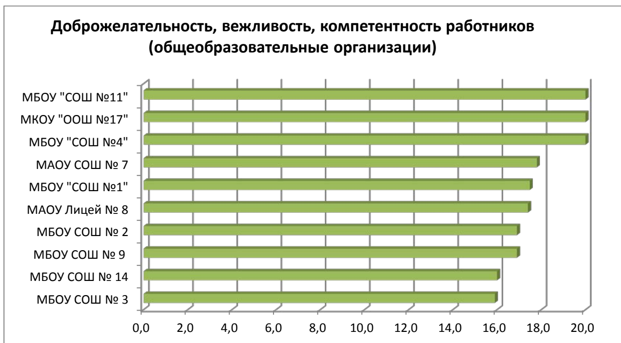
Диаграмма № 6

Наименьшее количество баллов по общим критериям, касающимся общей удовлетворенности качеством образовательной деятельности среди дошкольных образовательных учреждений набрали МАДОУ «Детский сад № 9 «Калинка», МБДОУ «Детский сад № 12 «Сибирячок», МАДОУ «Детский сад № 9 «Калинка» (диаграмма № 7).