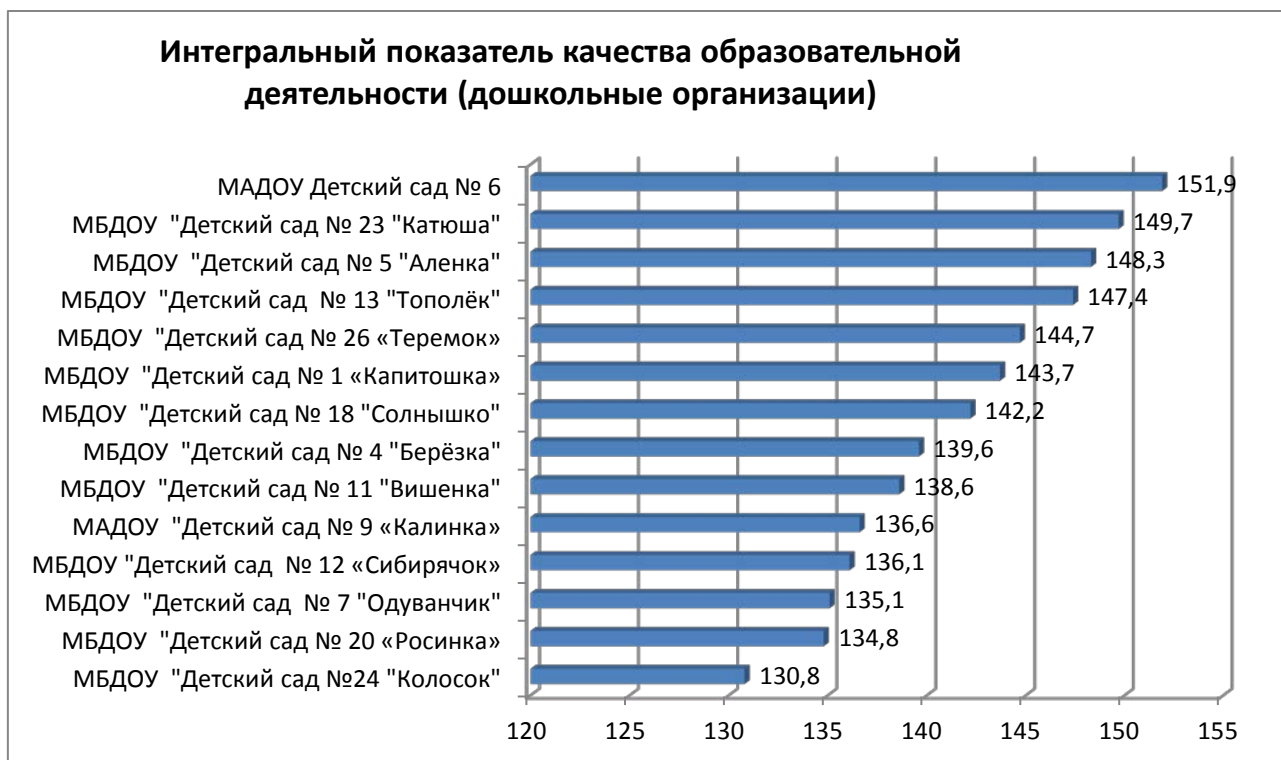
Диаграмма № 9