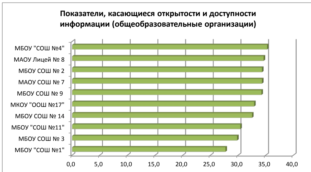
Диаграмма № 2

Учреждения дополнительного образования получили высокие оценки по показателям, характеризующим информационную открытость образовательной организации.